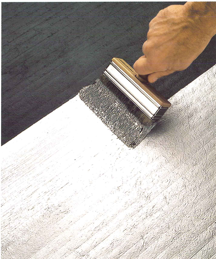
Aplicação do DERBISILVER em nova membrana de impermeabilização.

Para toda e qualquer aplicação especial contactar o nosso serviço técnico.